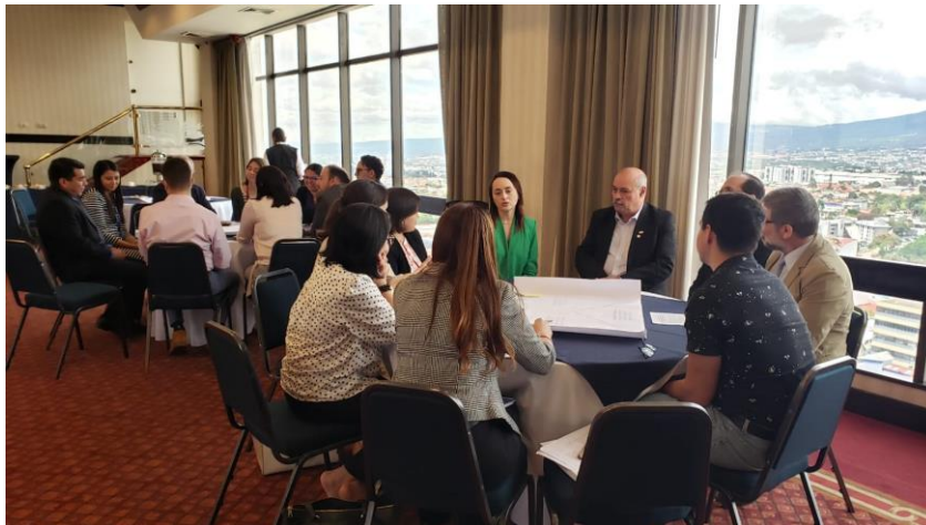
Taller “Contribuciones de la migración al desarrollo sostenible: el caso de Costa Rica” (16 de noviembre, 2022)