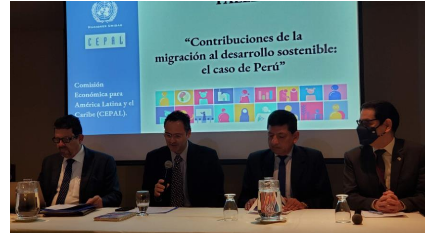
Taller “Contribuciones de la migración al desarrollo sostenible: el caso de Perú” (7 de septiembre, 2022)