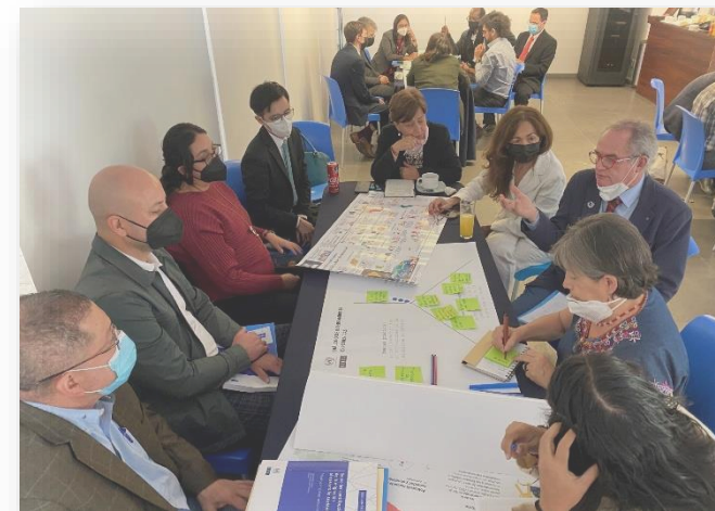
Taller “Contribuciones de la migración al desarrollo sostenible: el caso de México” (16 de septiembre, 2022)